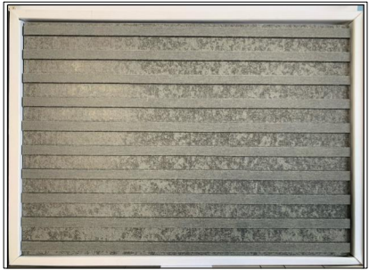
Bardage Equitone Linea (LT 20 Gris)