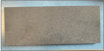
Bardage Equitone Tectiva (TE 20 Gris)